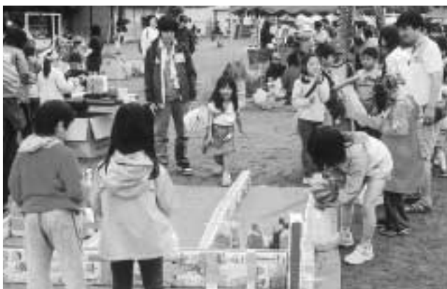
みんなで楽しくあそぼ~!

ぜひ皆さんで遊びに来てください。 【日時】5月8日(日) 午前10時~午後2時 【会場】第七小学校(雨天の場合は体育館と教室で開催します) 駐車場がありませんのでバスや自転車等をご利用ください。