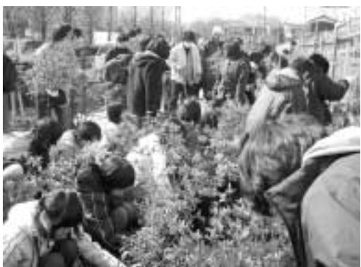
第十小・下里小・下里中の16年度卒業生が散策路沿いにツツジの記念植栽を行いました

この良い日にぜひお出掛けください。なお、この整備では、今までのコンクリートの護岸をなくし自然岸にしました。また、広場内の親水水路に「せせらぎ」を実現するため、降雨時の一定量以上増水した雨水は、この親水