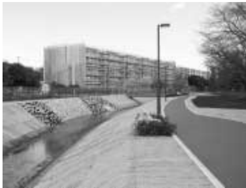
親水広場内のせせらぎ水路と散策路の様子(付近の護岸には芝生を育成しています)

市では黒目川上流域で黒目川雨水幹線の整備を進めています。ここでは、「人と水とを分離した従来型の治水機能本位の整備とは一味違つ、市民が水や自然とふれあうことができる親水事業を併せて進めています。 このたびはその一環として久留米西団地付近の黒目川親水広場が4月に一部オープンしました。水と緑にふれあいながら、ぜひお立ち寄りください。 詳しくは下水道課☎70・7759へ。