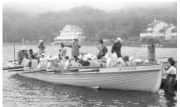
40人で力を合わせて大きなボートを動かします

開催日時 9月25日(日)午前7時、市役所1階屋外ひろば集合、午後7時ごろ帰着予定(日帰り) 雨天決行 大会会場 榛名町榛名湖畔 対象 市内在住・在勤・在学の小学4年生以上(ただし小学生の参加は保護者同伴)でカッターボートをこぐことが可能な方 募集人数 80人 参加費 高校生以上2000円、小学4年生～中学生1500円(軽食・交流会時の飲食、入浴料、集合場所からの交通費および保険料等を含む) 持ち物 着替え、タオル、雨具、飲み物、帽子。ぬれても汚れてもよい服装で 申し込みは8月18日(木)午前9時から、電話または生活文化課(市役所2階)窓口で先着順受け付け