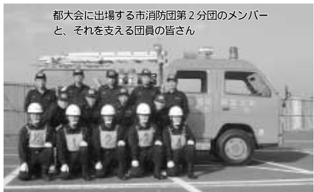
都大会に出場する市消防団第2分団のメンバーと、それを支える団員の皆さん

10月15日(土)、 都消防訓練所にお いて第35回東京都 消防操法大会を開 催します。同大会に は北多摩地区17市 を代表して、市消防 団第2分団がポン プ車操法の部に 出場します。 この部門は、5人 の消防団員が消防 車からホースを伸 ばし、前方にある2 つの標的を放水に よって倒します。標 的を倒すまでのタ イム、隊員の行動の 機敏さや規律の正確さを競つ ものです。 大会当日は一般の方も応援 見学ができますので、気軽に ご来場ください。