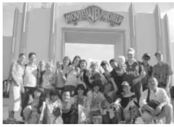
ホームステイの家族と一緒に

出発に先立って町役場で行われた壮行会では、石井町長が「いろいろのことを見たり聞いたたりして、一生の思い出になる海外派遣にしてく