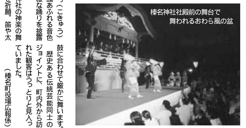
榛名神社社殿前の舞台上で舞われるおわら風の盆

この催しは、地域の伝統芸 能の継承が危ぶまれる中、歴 史と文化が漂う榛名神社を伝 統芸能の発信地にしよう、と 榛名町観光協会榛名神社支部 が企画。昼の部は町総合文化 センター、夜の部は町総合文 化センターで開催しました。