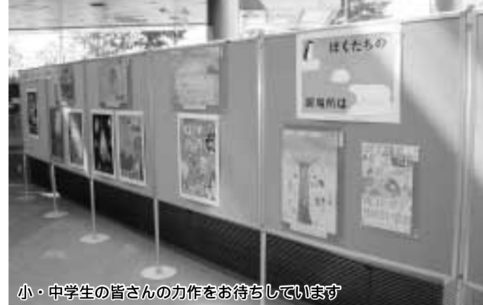
小・中学生の皆さんの力作をお待ちしています