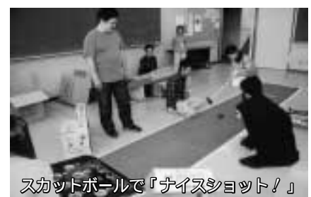
スカットボールで「ナイシヨット!」

日時 3月30日(木)午前10時~午後2時15分 会場 中央公民館 持ち物 弁当、水筒、敷物 当日直接会場へ 詳しくは公民館 ☎73・7811 へ。