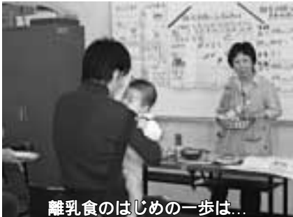
離乳食のはじめの一步は...

日時 3月23日(木)午後零時半~1時半受け付け。6カ月未満児でBCG予防接種のみの方は午後1時45分~3時半受け付け 会場 保健福祉センター 対象 17年11月6日~30日生まれの乳児 当日直接会場へ