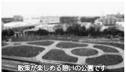
散策が楽しめる憩いの公園です

所在地 柳泉園グランドパーク(下里4-3-10、西武バス久留米西団地バス停から徒歩6分) 久留米市寄りに位置しています 詳しくは同組合施設管理課 ☎70・1549 へ。