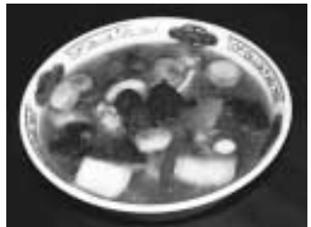
梅宝(うめーん)だから(ラーメン)

スにあざりと菜の花を加え、梅で仕上げたさつぱり「春色スパゲティ」、梅や海老などさまざまな具がちりばめられた「梅宝(うめーん)だから(ラーメン)、カスタードクリーム」の甘さと梅肉の甘酸っぱさが絶妙なバランスの「梅肉のタルト」など、独創的で美味しい梅料理が楽しめます。