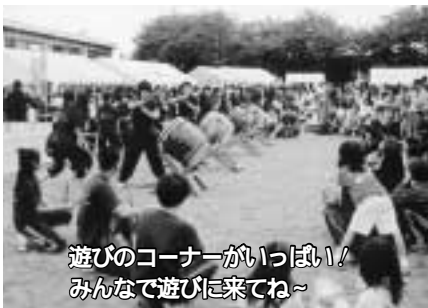
遊びのコーナーがいっぱい！ みんなで遊びに来てね～

さわやかな青空とまぶしい新緑の中、33回目を迎える「東久留米子どもまつり」。太鼓や歌・ダンスなどが発表される「舞台」を中心に、遊びの広場・模擬店・手作り工作・スポーツチャンバラなど、楽しいコーナーが校庭いっぱい設けられます。