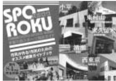
各市施設を紹介した小冊子「スポロク」表紙