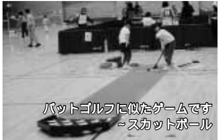
バットゴルフに似たゲームです～スカットボール