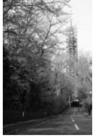
スカイタワー西東京がランドマークです

5月の休館日 8日(月)～11日(木) 15日(月) 22日(月)～25日(木) 29日(月)です。