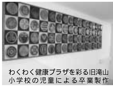
わくわく健康プラザを彩る旧滝山小学校の児童による卒業製作