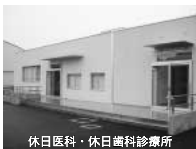
休日医科・休日歯科診療所

栄養指導・健康づくり・歯科保健・母子保健・老人保健・予防衛生に関すること 休日医科・休日歯科診療所 休日における市民の急病患者に対する応急診療 子ども家庭支援センター 子育てなんでも相談・子どもからの相談・子育てについての情報提供、子どもへの虐待に関する相談