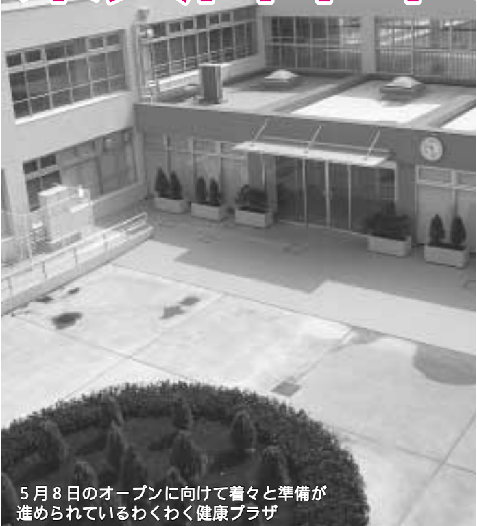
5月8日のオープンに向けて着々と準備が進められているわくわく健康プラザ