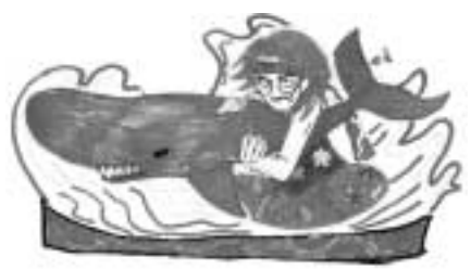
ねぶた最優秀デザイン作品