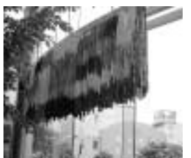
屋内ひろばを彩る千羽鶴

詳しくは総務部総務課 庶務係 ☎470-7714 へ。 平和の願いを込めて鶴をおりませんか 市では、市民の皆さんに鶴をおっていただき、平和の千羽鶴」として、市役所1階屋内ひろば、上の原・ひばりが丘・滝山の各連絡所、中央図書館、公民館等に置画です。その後8月上旬に原爆被爆者の方のごめい福と恒久平和を祈念して、千羽鶴を被爆地へお送りします。協力をお願いします。 折り紙は、6月19日(月)~7月7日(金)、市役所1階屋内ひろば、上の原・ひばりが丘・滝山の各連絡所、中央図書館、公民館等に置画展を開催します。 【日時】6月23日(金)~27日(火) 午前9時~午後7時 【会場】市民プラザホール 【入場料】無料 当日直接会場へ。