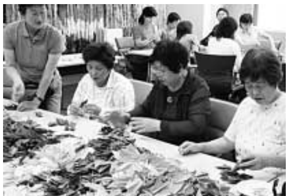
平和への思いを鶴に託して

詳しくは総務部総務課 庶務係 ☎470-7714 へ。 平和の願いを込めて鶴をおりませんか 市では、市民の皆さんに鶴をおっていただき、平和の千羽鶴」として、市役所1階屋内ひろば、上の原・ひばりが丘・滝山の各連絡所、中央図書館、公民館等に置画です。その後8月上旬に原爆被爆者の方のごめい福と恒久平和を祈念して、千羽鶴を被爆地へお送りします。協力をお願いします。 折り紙は、6月19日(月)~7月7日(金)、市役所1階屋内ひろば、上の原・ひばりが丘・滝山の各連絡所、中央図書館、公民館等に置画展を開催します。 【日時】6月23日(金)~27日(火) 午前9時~午後7時 【会場】市民プラザホール 【入場料】無料 当日直接会場へ。