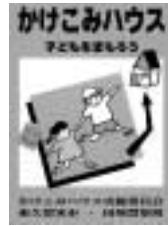
目印のステッカー

「かけこみハウス」は、各中学校地区のかけこみハウス実施委員会(構成員はPTA、学校、自治会、商店会、地区青少年健全育成協議会等)の皆さんが中心となって参加協力を呼び掛けています。今回新たに参加していただけの協力家庭等を募集します。多くの皆さんの協力をお願いします。