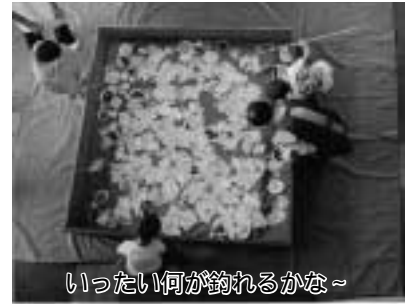
いったい何が釣れるかな～

【日時】8月25日(金)午前10時～午後2時15分 【会場】中央公民館 【対象】市内在住で18歳未満の障害のある方(親子での参加も可) 【持ち物】弁当・水筒・数物