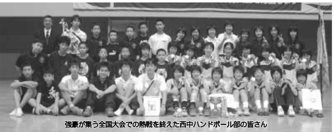
強豪が集う全国大会での熱戦を終えた西中ハンドボール部の皆さん

【日時】9月16日(土)午前9時半～11時半 【会場】東久留米市民センター 【参加費】無料 【定員】30人 【申し込み】8月14日(日)午後10時から電話で生活文化課へ 【問い合わせ】470-7380 【主催】西武池袋線清瀬駅南口 【協賛】東久留米市、多摩北部都市広域行政協議会、東久留米市、東村山、清瀬、西東京の5市で構成、共同事業