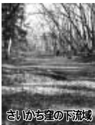
さいかち窪の下流域

さわやかウォーキングで一緒に汗をかきませんか。秋風の心地良い季節、澄み切った空の下、市内の風景を楽しみましょう。今回は柳窪地区を中心にウォーキングをします。