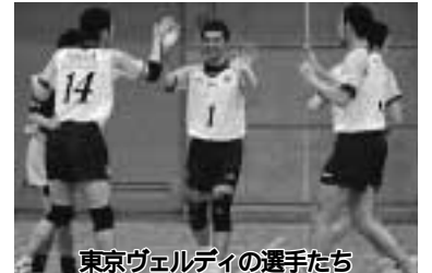
東京ヴェルディの選手たち

部 同女子の部 一般の部。は男女混合可。個人や10人に満たなくても申し込み可 参加費 無料 申し込みは9月29日(金)までに、電話で体育協会事務局(スポーツセンター内)☎470・2722へ 当日参加も受け付けます。 詳しくは同事務局へ。 小・中学生のためのバレーボール「東京ヴェルディ」模範試合見学とレッスン ~市体育協会主催 男子バレーボールV1リーグ所属「東京ヴェルディ」による模範試合とチーム選手の指導によるレッスンを開催します。バレーボールの生の迫力と一流の指導をこの機会にぜひ味わってください。