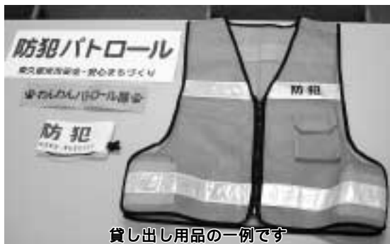
貸し出し用品の一例です

「取り組むことで、安全で安心して暮らせる「水と緑とふれあいのまち東久留米」を実現しましょう。」