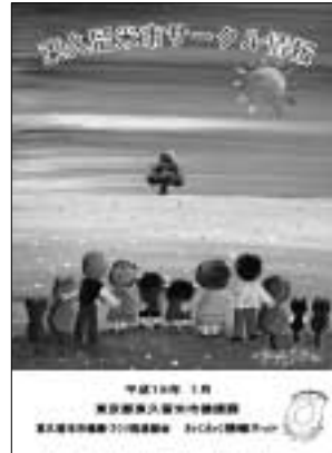
サークル活動情報が満載です

18年5月に広報紙でサークル情報を募集し、サークル活動拠点へ情報提供をお願いしたところ、161団体から情報提供をいただきました。ぜひご活用く