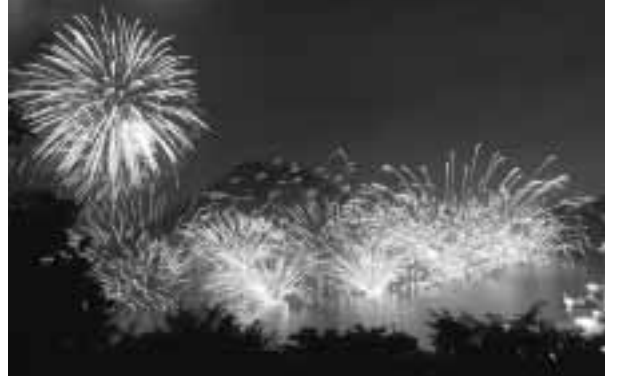
湖に映し出される色とりどりの花火

メインや湖を周遊するポイントから投げ込まれる水中花火の色鮮やかな光のコントラストが特徴です。また、水中花火は、いくつもの扇を開いたように