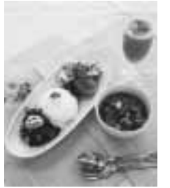
いつもの献立に変化を加えて!

日時 9月26日(水) 午前9時45分~午後1時 会場 わくわく健康プラザ 費用 500円程度 定員 先着24人 申し込みは9月3日(月)から電話で保健サービス係へ