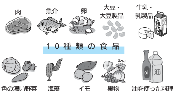
色濃い野菜、海藻、イモ、果物、油を使った料理