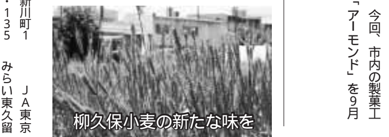
柳久保小麦の新たな味を ご賞味ください!

柳久保小麦を使用した香ばしい生地、あざりとした白餡(みこ)と餡(はちみつ)を入れてくわを出し、刻んだアーモンドとアーモンドパウダーを加えました。日本茶だけでなく、ティーや紅茶にも合う「アーモンド」かいらんとうを、従来の黒糖味と食べ比べてみてください。