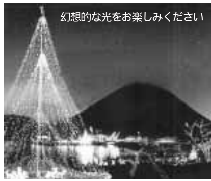
幻想的な光をお楽しみください

(土曜・日曜日は除く) 中央町地区センター(火曜日は除く) 詳しくは同協議会総務係 ☎471・0294へ。