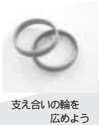
支え合いの輪を広めよう

受講修了者には、認知症サポーターの目印となる「オレンジリング」を交付します。詳しくは同係へ。