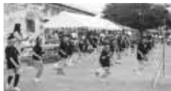
みんなで楽しく大江戸ダンス!

日時 12月14日(金)午後7時から 会場 中央公民館第1・2学習室 詳しくは公民館 ☎473・7811へ。