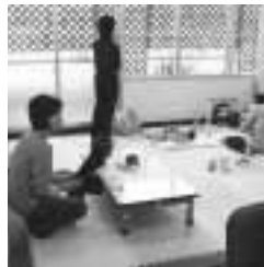
地域活動室の様子

地域活動室は、室内・遊具等の整備のため、12月28日(金)は休みます。総合相談は行います。