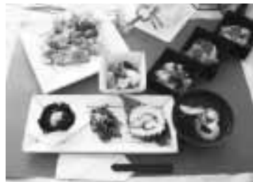
一年の始まりは健康的なお正月料理で