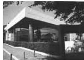
より快適な空間に生まれ変わります

公民館を快適に利用していただくため、来年1月から2カ月間、空調設備の改修工事および外壁補修工事を施工します。 この間、公民館を全館閉館することになります。しばらくの間ご不便をお掛けしますが、ご理解とご協力をお願いします。 【利用再開日】20年3月18日(火) なお、閉館中の施設予約システムの窓口予約は、今まで通り公民館で受け付けます。 詳しくは同館☎473・7811へ。