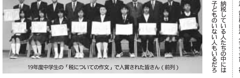
19年度中学生の「税についての作文」で入賞された皆さん(前列)

まず私は、税ってなんだろ?って思い、調べてみました。疑問に思った税について仕事で働いている父の給料説明書を見てもらいました。初め見ると、並んでいる数字がいろいろ意味を現しているのかわかりませんでした。母に聞いてみたところ、税金は、所得税、地方税、保険料などで、お給料の中からその額が差し引かれていくのがわかりました。その税金が、どんなに使われているのか調べてみた。学校に関する教育費や、公民館、図書館などの文化活動。そして私たちの生活を守るための警察、消防、救急車などにも使われていること