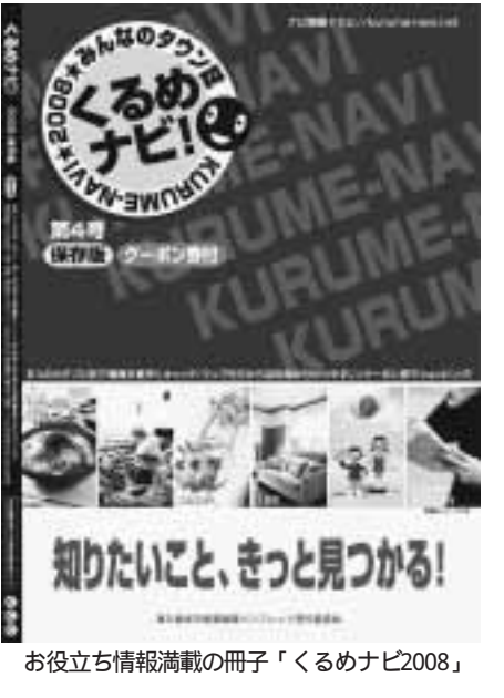
お役立ち情報満載の冊子「くるめナビ2008」