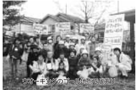
ウォーキングのゴール地点でパチリ

5月11日(日)に体育指導委員会による市民参加のウォーキングを実施します。さわやかな新緑の風薫るなか、ご家族やお友達で「水と緑とふれあいのまち」東久留米のウォーキングを楽しんでみませんか(一人でも歓迎)同行の体育指導委員がコース周辺の昔話などを解説します。 コースは、市東部を巡る中央公民館～落合川～南沢湧(ゆう)水～スポーツセンター～黒目川～小山れんげ公園～中央公民館の約7kmです。途中チェックポイントでのクイズなどを行い、ゴール後には飲み物と参加賞を用意しています。 日時・スタート・ゴール 5月11日(日)午前10時(9時半集合)に中央公民館をスタート、同館に午後零時半ごろ帰着。小雨決行 参加費 中学生以上が300円、小学生以下が200円(保険等費用) 小学生以下は保護者同伴。歩きやす