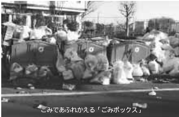
ごみであふれかえる「ごみボックス」