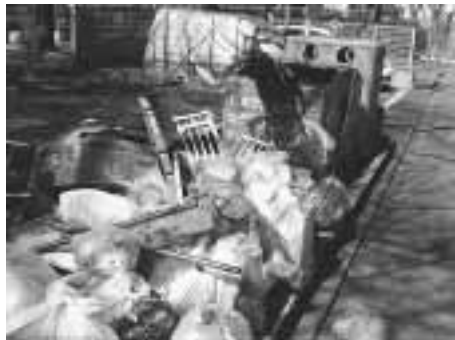
ボックス周辺の収集しているごみの山

戸別収集ってどういふ方式なの？ 家庭ごみの収集を有料化している自治体では、それに前後して戸別収集方式を導入する所が大変多くなっています。