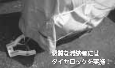
悪質な滞納者には タイヤロックを実施!

市では、納期限を過ぎても納付されない方に対し、督促状・催告書等の文書の送付や電話による催告を行い、早急な納税をお願いをしています。それでも納付・相談がない方には、納期内に納付された方との公平性を保つため、法律に基づき財産の差し押さえ等の滞納処分を積極的に行っています。なお、本税を完納したけれど延滞金だけが未納となつて