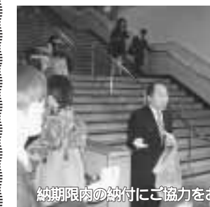
納期限内の納付にご協力をお願いします

「口座振替をご利用ください」仕事が忙しくてなかなか銀行の窓口に行けない、ついでに税金を納めるのを忘れてしまった、というような場合があると思います。しかし、ついでに、ついでに、ついでに、市税等が累積したこと未納額が高額となり、ますます市税等の納付が困難となつて