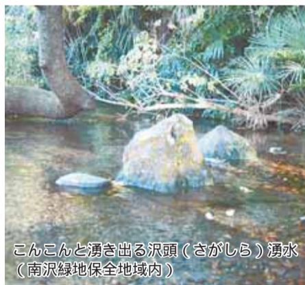
こんこんと湧き出る沢頭(さがしら)湧水 (南沢緑地保全地域内)

市では「水と緑とふれあいのまち東久留米」をまちづくりの目標として掲げています。20年6月、東久留米の豊かな自然の一つ、落合川と南沢湧水群(ゆうすいぐん)が、環境省の「平成の名水百選」に都内では唯一選定されました。この選定は同所の清らかな湧(わ)き水、水辺環境はもとより、その環境を保全するための、たくさんの方たちによる長年の地道な努力の結果でもあります。今年(うし)は、地に足をつけ、一歩一歩しっかりと地道に進んでいくことが結果へとつながっていきます。ゆっくりでもいいから目標に向かって足を前に進めていきましょう。