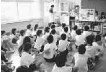
小学生へ公演する「禁煙キャラバン」

乳がん検診の申込者が予定人数に達しなかったため、再度募集を行います。 【対象】市内在住の40歳以上の女性で、今年1月1日〜12月31日までに奇数年齢になる方(昭和17年、19年等、奇数年に生まれた方が対象となります)。