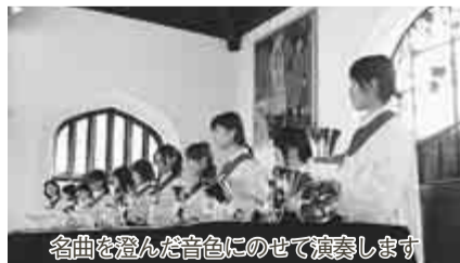
名曲を澄んだ音色にのせて演奏します

▼日時 12月19日(土) 午後2時～3時▼会場 市役所1階屋内ひろば▼出演 立教学院諸聖徒礼拝堂ハンドベルクワイア▼曲目 「ホワイトクリスマス」「聖歌81番かみにはさかえ」「ママがサンタにキスをした」ほか▼入場料 無料◆当日直接会場へ 詳しくは市民プラザ☎470・7813へ