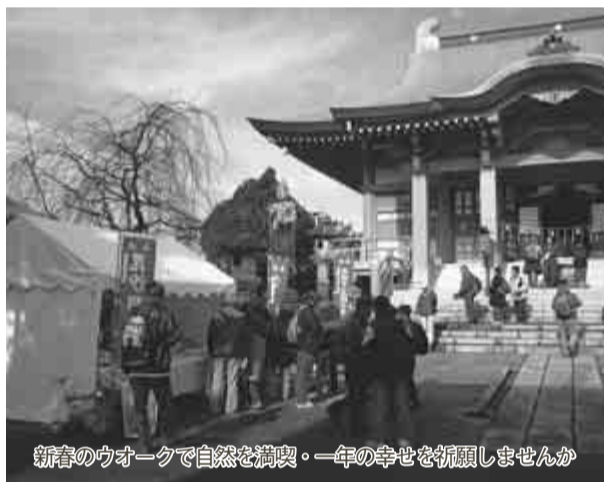
新春のウオークで自然を満喫。一年の幸せを祈願しませんか

▼日程 22年1月9日(土)。雨天決行 ▼受付時間・会場 午前10時～11時半に