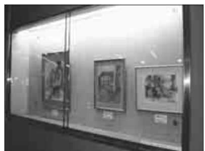
東久留米駅構内「市民ギャラリー」の展示の様子

名(団体の場合は団体名・代表者)・電話番号・作品の種類を記入の上、〒203-8555、市役所生涯学習課あて郵送を(返信用にも住所・氏名を記入してください)。詳しくは同課生涯学習係☎470・7784へ。