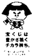
宝くじは豊かさ築くチカラ精進。

今年度、本市では5つの自治会でリヤカー・掲示板・すべり台・フィットネス器具・物置・芝刈機を宝くじ助成金で整備しました。この助成事業は、財団法人自治総合センターが宝くじ普及広報事業費として受け入れる受託事業収入を財源として、住民の行うコミュニティ活動を促進し、その健全な発展を図るとともに宝くじの普及広報を目的に行われています。詳しくは生活文化課☎470・7738へ。認知症の方を介護する家族の交流会「つつじ会」を開催します 認知症介護での不安や心配ごとなど、気軽に話しにご来場ください。▼日時 3月15日(月)午後1時～2時