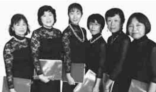
「魔女と侍女」の皆さん

【日時】 3月20日 (土) 午後2時～3時 【会場】 市役所1階屋内ひろば 【出演】 魔女と侍女 【曲目】 「Flora gave me fairest flowers」 「Ave Maria」 「さくらさくら」 ほか 【入場料】 無料 当日直接会場へ。 詳しくは市民プラザ ☎470・7813へ。