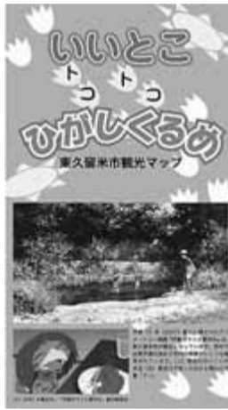
いいとこトコトコひがしくるめ 東久留米市観光マップの表紙

市では、市内の見どころをとりまとめた観光マップを、先月発行しました。「東久留米の特産品」や、「ひがしくるめの四季」(湧(ゆう)水(みづ)川の生まれるまち)「東久留米ヒストリア」(わがまち)「味(あじ)まん」などを紹介します。詳しくは産業振興課☎470・7743へ。