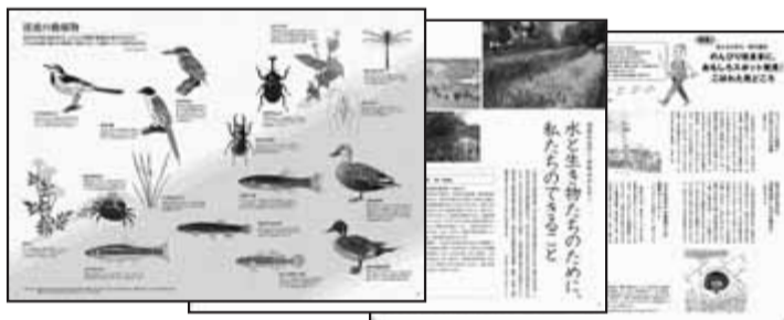
落合川と南沢湧水群 パンフレットの表紙

※ガイドマップ東久留米は有料(150円)につき、生活文化課(市役所2階)で販売しています。