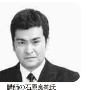
講師の石原良純氏

テレビ番組でもおなじみの俳優で気象予報士の石原良純氏をお招きし、「空を見よう」をテーマに講演をしていただきます。