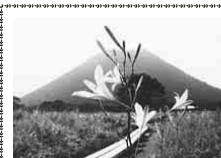
鮮やかな黄色のゆうずげの花と榛名山

7月上旬から宿泊者を対象に、ホテルやゆうずげの花を觀賞するミニツアーのイベントも開催します(詳しくは榛名観光協会☎027・374・5111へ)。夏の夜を、高原で可憐なゆうずげの花や幻想的なホテルと一緒に過ごしてみたいかごでしょうか。(高崎市榛名支所地域振興課)