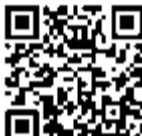
メール配信登録用QRコード

携帯電話からは、 [touroku@info.keishicho.metro.tokyo.jp]へ空メールを送信すると、登録用のメールが返送されますので、手続き方法に沿って登録することができます。