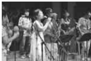
出演のラ・ムシカ・サブローサ