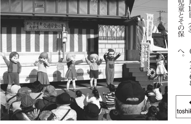
交通安全の集いに参加する児童たち

交通安全の集いに参加する児童たち。交通安全の集いに参加する児童たち。 交通安全の集いに参加する児童たち。