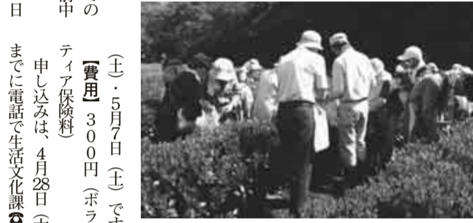
小山茶園における活動の様子

今年も、同クラブでは新しいメンバーを募集します。春には茶園見学会や紅茶教室、お茶を使った料理教室などの楽しいイベントも行っています。興味のある方は、ぜひ一度入会ください。