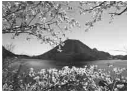
桜が映える榛名富士

「水彩色えんぴつ画」ほか受講者募集 社会福祉協議会では、上記のほか太極拳・コーラス・フォークダンス・文学・書道の受講者を募集します(55歳以上、6月