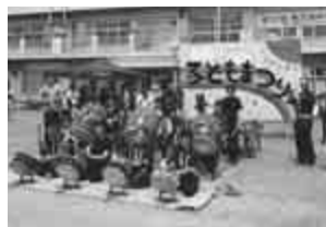
みんなで遊びに来てね!

【会場】第七小学校 ※雨天の場合は 体育館と教室で開 催します。駐車場は ありませんので、バ スや自転車などを ご利用ください。 詳しくは生涯学習課 ☎470・7784へ。