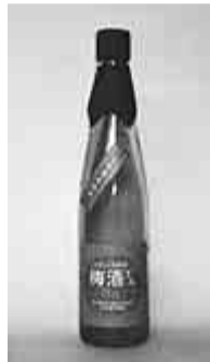
ひがしくるめの梅酒さん

東久留米酒販組合では、昨年5月に限定販売し大好評のうちに完売した「ひがしくるめの梅酒さん」を今年も発売します。市の特産品「梅うふふ」に使用され人気を博している梅の品種「白加賀」。