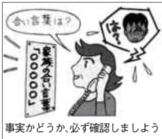
事実かどうか、必ず確認しましょう

詳しくは田無警察署生活安全課防犯係 ☎467・0110（内線2612）、または市防災防犯課防犯防犯係（内線2223）へ。