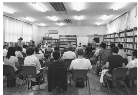
昨年の様子(大門中学校にて)

今年度のタウンミーティングのテーマは「地域防災と絆づくり」です。3月に発生した東日本大震災を教訓とし、地域における防災対策や、地域の大切さを再認識した絆づくりについて、市民の皆さんの声をお聴かせください。 【対象】市内在住・在勤・在学の方 【お願い】原則として、お住まいなどの区域の会場へ、ご来場ください。 なお、各会場とも駐車施設がありませんので、車での来場はご遠慮ください。 詳しくは生活文化課(内線2143)へ。