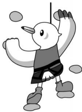
スポーツ祭東京2013 マスコットキャラクターの「ゆりーと」

このほかにも会場内では、多摩物産展やステージパフォーマンスなど、楽しいイベントが盛りだくさんです。主催は東京都、社団法人東