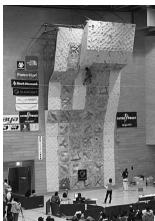
22年3月にスポーツセンターで開催された「全日本ユースクライング選手権大会」の様子