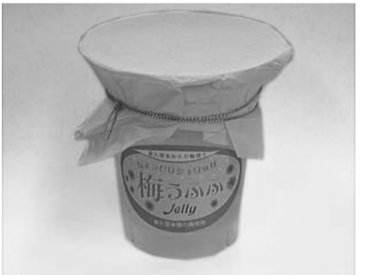
微発泡梅ワインを使用したゼリーが新発売

ちょっぴりシュワッな梅うふふ ゼリー 4月15日(日)新発売! 東久留米酒販組合では、昨年6月に 新発売した「東久留米の梅酒さんゼ リー」に引き続き、ゼリー第二弾として、 微発泡梅ワイン「ちょっぴりシュワッ な梅うふふ」を使用したゼリーを開発 し、同組合加盟取扱店で新発売します。 ぜひお試しください。※ゼリーには 炭酸は含まれません。アルコール2% 未満が含まれます。