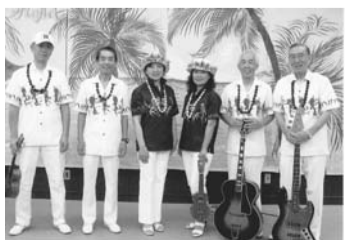
出演のジョイアロハの皆さん

7月7日(土)午後2時～3時 市役所1階屋内ひろば 主な曲目は「パーリーシェル」「ナレイオハワイ」「ハワイの夜」ほか 無料 出演はジョイアロハ 当日直接会場へ 市民プラザ ☎470・7813