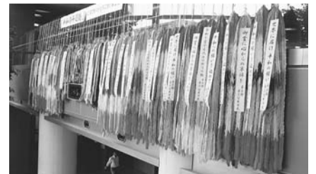
市役所ロビーに飾られた「平和の千羽鶴」

【表記の凡例】 日日時 場所 内容 対象・資格 定員 講師 費用 持ち物 注意 その他 申し込み 問い合わせ