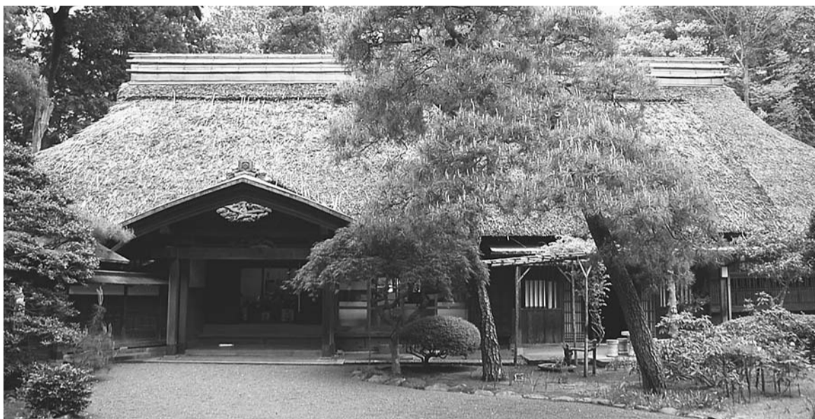
国登録有形文化財の「村野家住宅・主屋」(柳窪四丁目)

都内の各市区町村では文化財の公開事業のほか、見学会や講座など、さまざまな企画事業を実施します。関連の企画事業は、10月1日～11月30日の期間に行われます。都が作成した事業内容に関するガイドブックは、文化財めぐりの解説書としても便利で、市政情報コーナー(市役所