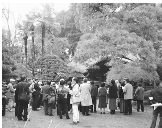
特別見学会で「村野家住宅」を見学する皆さん

「東京文化財ウィーク」は、都内各地にある文化財を一堂に公開し、都民の皆さんに親しんでいただくために、毎年行われています。秋の一日、身近な歴史と文化財に触れてみてはいかがでしょうか。詳しくは郷土資料室(文化財ウィークガイドブック)をご覧ください。☎472・0051へ。