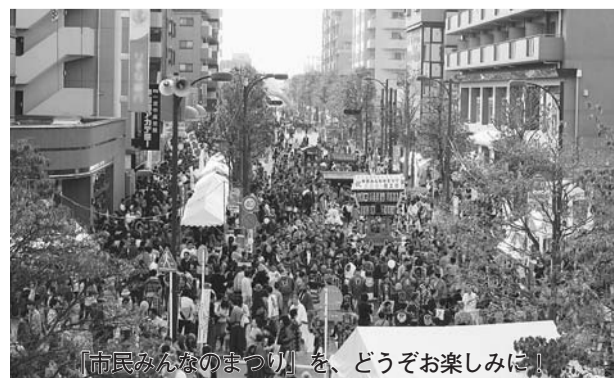
「市民みんなのまつり」を、どうぞお楽しみに!