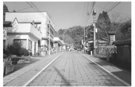
情緒ある町並みを感じさせる社家町

しているお店の多くは、まさにその伝統を今に伝承する貴重な宿坊の名残りです。祭りでは、お楽しみ抽選会のほか、今年のは地元で活動しているミュージシャンなどが演奏を