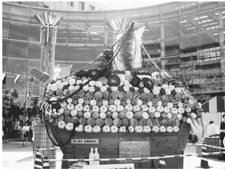
毎年好評の野菜で作った豪華な宝船

【注意】同まつりの開催期間中、会場内へ自動車や自転車などの乗り入れはできません(左下図参照)。