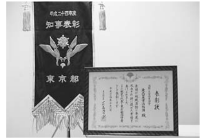
都知事から贈られた表彰旗と表彰状

10月1日に東久留米市消防団が、地域消防の発展に尽力し、特に優れた業績を上げたと認められたため、「消防・災害対策功労」として、都知事から表彰されました。詳しくは防災防犯課 ☎470・7769へ。