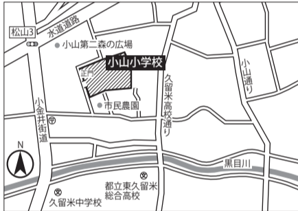
▼第7投票区 小山小学校